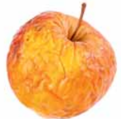
Lebensmittel, die nicht erster Qualität entsprechen, bleiben oft in den Regalen liegen.

Dank einer ausgeklügelten Logistik und einer genauen Bestellplanung erhalten die einzelnen Filialen möglichst nur die Warenmenge, die sie innert nützlicher Frist verkaufen können. Bleiben trotz guter Planung einige Produkte in den Regalen liegen oder läuft ihr Mindesthaltbarkeitsdatum demnächst ab, >