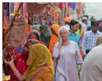
La comédie britannique The Best Exotic Marigold Hotel met en scène des retraités plutôt jeunes d'esprit.

Les membres de la section Soleure de Forum elle ont terminé l'année 2012 sur une note d'humour, en visionnant la comédie britannique The Best Exotic Marigold Hotel , un film sur l'art de rester jeune passé l'âge de la retraite. Les spectatrices ont pu échanger leurs réactions lors de l'apéritif qui a suivi la projection.