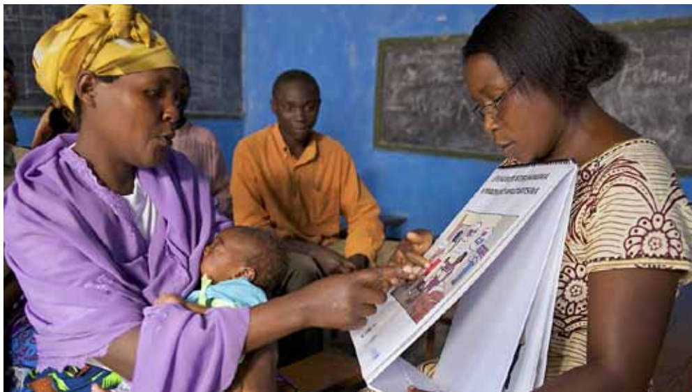
Le programme mère-enfant est un important projet de l'Unicef.

Dans un registre très différent, la rédactrice du Bulletin a accompagné une journée durant des membres de la section Schaffhouse, avides de découvertes. Une sortie aux multiples étapes.