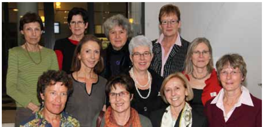
Une délégation de membres de Forum elle a participé à la Journée des consommateurs.