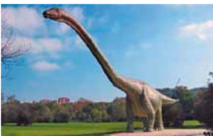
Wahrzeichen des Parks: der riesige Dinosaurier.