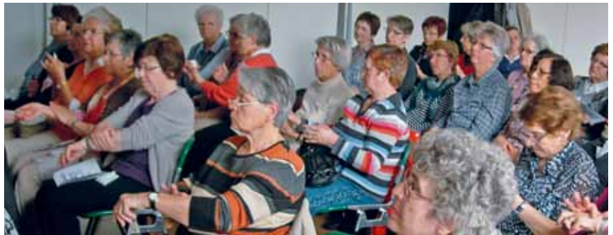
Sämtliche Produkte wurden eifrig ausprobiert

Die Frauen waren am Ende des Vortrags begeistert, hatten sie doch wertvolle, zusätzliche Informationen direkt an der Quelle erfahren, denn die Mibelle Cosmetics, ein Unternehmen der Migros-Industrie, begann vor 50 Jahren mit der