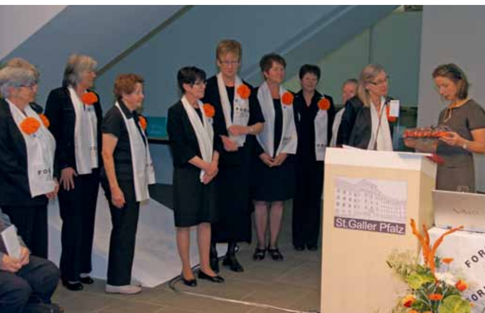
Dank an die Schar der fleissigen und freundlichen Helferinnen.