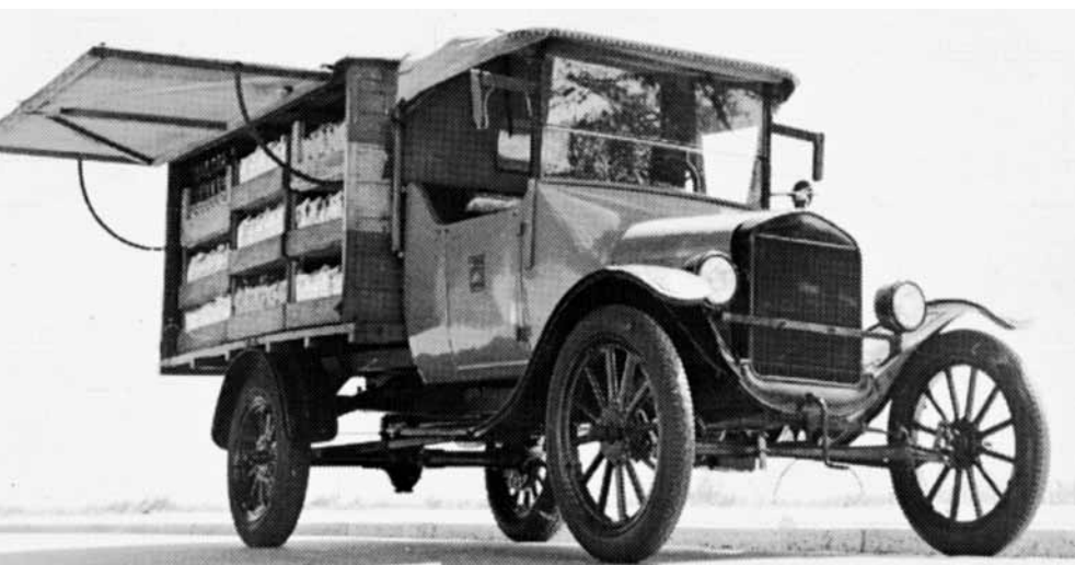
Einer der fünf ersten Verkaufswagen von Gottlieb Duttweiler.

2012 ist das internationale Jahr der Genossenschaften. Wir feiern – feiern Sie mit uns!