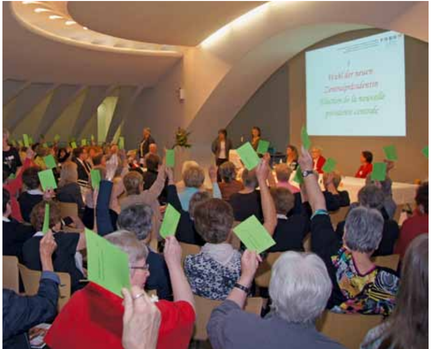
Wahl der neuen Zentralpräsidentin.

Nächste Delegiertenversammlung: 7. Mai 2013 in Bellinzona Weitere Bilder www.forumelle.ch