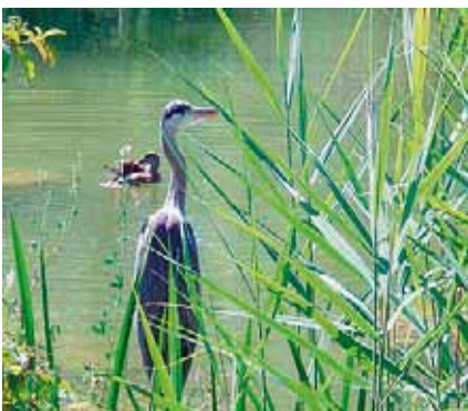
Der aufmerksame Reiher fühlt sich wohl.