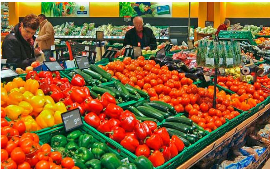
Die Früchte- und Gemüseabteilungen sind ein Paradebeispiel für eine ansprechende, kundenfreundliche Ladenpräsentation.

Gerade mit dem guten Ergebnis bei den Serviceleistungen heben sich die Schweizer Supermärkte vom Rest der Schweizer Detailhandelsbranche ab. Über alle besuchten Geschäfte hinweg (von Apotheken über Buchhandlungen bis hin zu Schuhgeschäften) liegt die Bewertung der Serviceleistungen nämlich bei gerade mal 23 Punkten – und damit hinter Deutschland (27 Punkte).