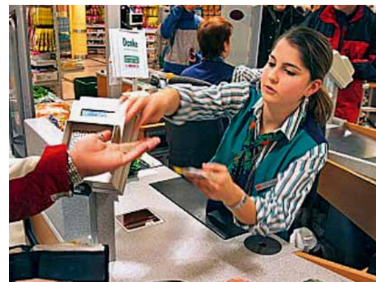
Auch das gehört zum Kundenservice: Eine nette, zuvorkommende Bedienung an der Kasse.