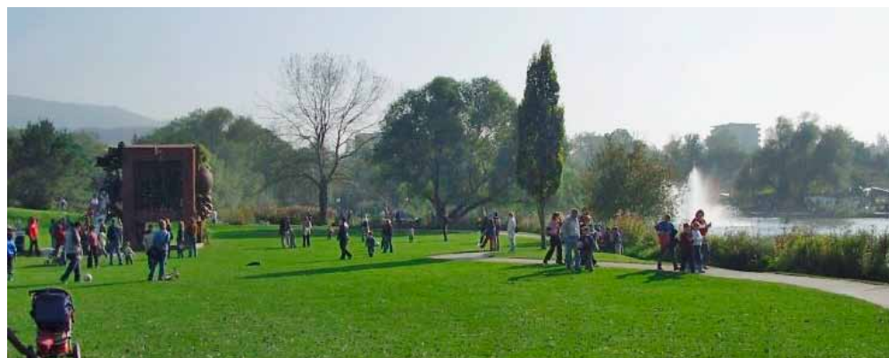
Lebensqualität pur: Spazieren und flanieren in der grünen Lunge.