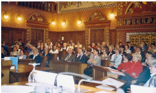
Assemblée des déléguées 2002 à Bâle. Coup d'œil dans la prestigieuse salle du Grand Conseil.

d'une excursion organisée par sa section la somme symbolique de 4 fr. 50.