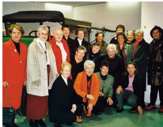
Conférence des présidentes à Zurich en 2005.