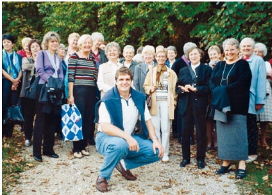
Séminaire de formation 2002 à Macolin, avec l'athlète Werner Günthör (devant).