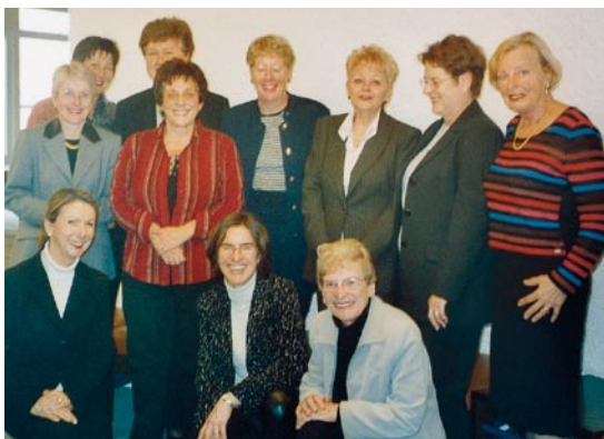
Séance du comité central à Berne en 2004.

Le séminaire des 23 et 24 février à Interlaken, organisé en lieu et place de la conférence des présidentes de printemps, est une rencontre qui se veut être au premier chef un cadeau d'adieu de la présidente centrale sortante. Un numéro spécial du Bul-