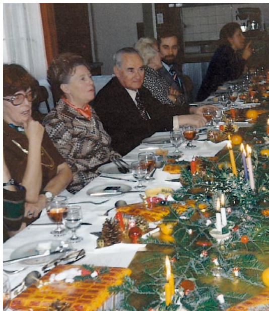
Conférence des présidentes en 1978 (au centre Ernst Melliger).

Citation extraite du rapport annuel de 1981