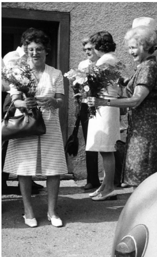
Visite de l'école de Näfelsberg (GL) en 1978.

fois, s'agissant de cette initiative au texte irréaliste, l'ASCM considère qu'elle n'est pas le meilleur moyen de toucher au but. Mieux vaut modifier les lois et règlements et promouvoir un changement de mentalité chez les hommes comme chez les femmes, estime-t-elle. Croire qu'un article constitutionnel permettra d'y parvenir est une illusion. En 1979, le débat ne porte en réalité plus sur le principe de l'égalité, qui est admis, mais sur le tempo contesté de sa mise en œuvre. C'est pourquoi l'ASCM ne l'a pas soutenue.