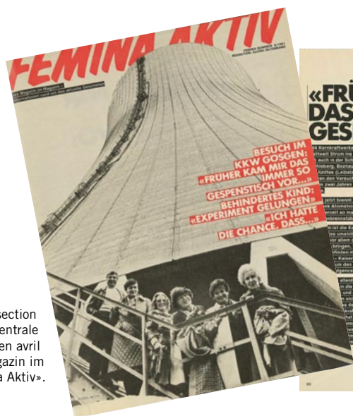
Les membres de la section Zurich visitent la centrale nucléaire de Gösigen en avril 1981.

En 1981, l'ASCM se penche sur un nouveau sujet, le tiers monde. Le comité central estime important que l'ASCM contribue à diffuser largement des informations objectives sur ce domaine de préoccupation traité lors de la conférence des présidentes du 3 novembre. A cette occasion, les participantes reçoivent du matériel d'information destiné à être distribué à tous les membres de l'ASCM afin de faire