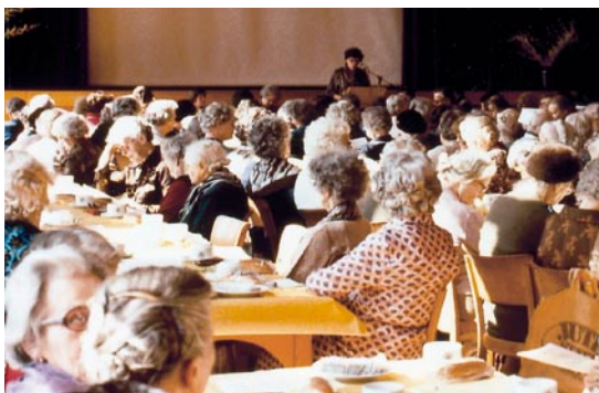
Assemblée des déléguées 1979 à Genève.