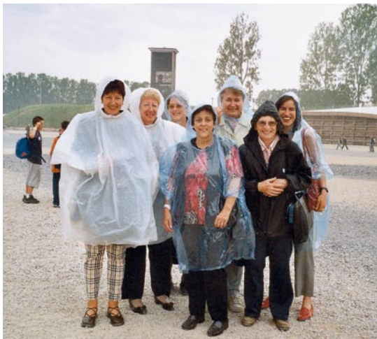
Le comité central visite Expo.02.

La collaboration avec seniorweb.ch connaît un heureux développement. FORUM elle apparaît désormais bien en vue sur la page d'accueil du site.