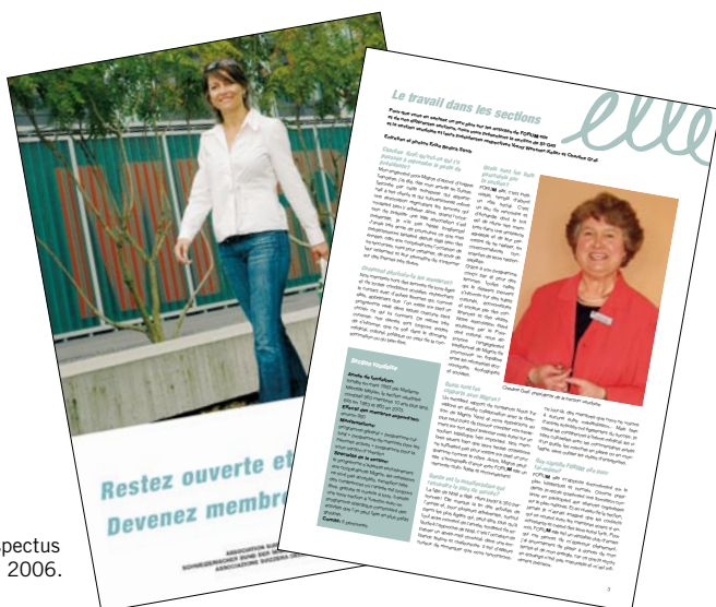
Nouveaux prospectus 2005 et Bulletin 2006.

Le Bulletin trilingue marque un grand progrès. Non seulement, il s'étale désormais sur seize pages couleur, mais encore son contenu s'est enrichi. Ainsi y sont publiés en plus de l'éditorial et du traditionnel compte-rendu de l'assemblée des déléguées deux portraits de section, un article consacré à l'engagement de Migros au-delà du rapport qualité-prix favorable des produits ainsi qu'un article sur