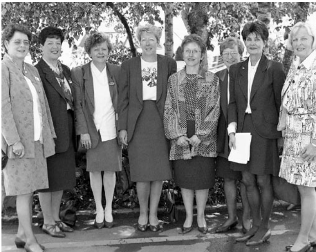
Assemblée des déléguées 1996 à Lucerne.

Pour leur conférence de septembre, les présidentes sont invitées à une visite de Limmatdruck SA, qui célèbre son 50 e anniversaire. Elles se rendent aussi bien à l'imprimerie de Spreitenbach qu'au siège des rédactions de la presse Migros à Zurich.