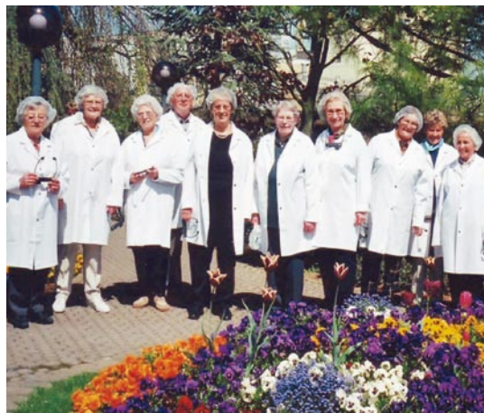
Les membres de la section Schaffhouse lors d'une visite d'entreprise.